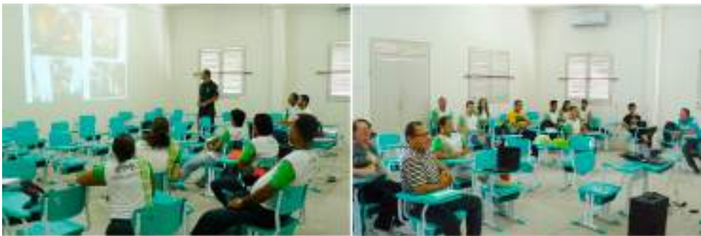
Figura 7. Fotos das salas de aula do Curso Superior de Tecnologia em Agroecologia, Instituto Federal de Educação, Ciência e Tecnologia, Campus Barreiros, Pernambuco, Brasil

Na última seleção foram disponibilizadas 40 vagas para os interessados em integrar o corpo discente do curso (Figura 7). Os estudantes ingressaram através do Sistema de Seleção Unificada (SiSU) 7 . A experiência em sala de aula mostra que os discentes, em sua grande maioria, chegam à sala de aula muito mais atraídos pela possibilidade de estar um curso superior do que em estar efetivamente em curso de agroecologia. Como o campus Barreiros é o único que oferece curso superior público na região, os estudantes terminam sem muitas opções para escolha do curso superior, isso numa rápida conversa pode ser diagnosticado nos primeiros dias de aula: a maioria dos aprovados na seleção nem sabem o que é agroecologia e alguns optaram pelo curso, pois os termos “agro” e “ecologia” soavam-lhes como interessantes 8 .