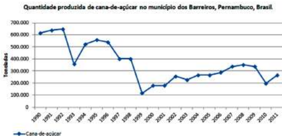
Figura 2. Gráfico da quantidade produzida, em toneladas, de cana-de-açúcar no município dos Barreiros no período entre os anos 1990 e 2011.