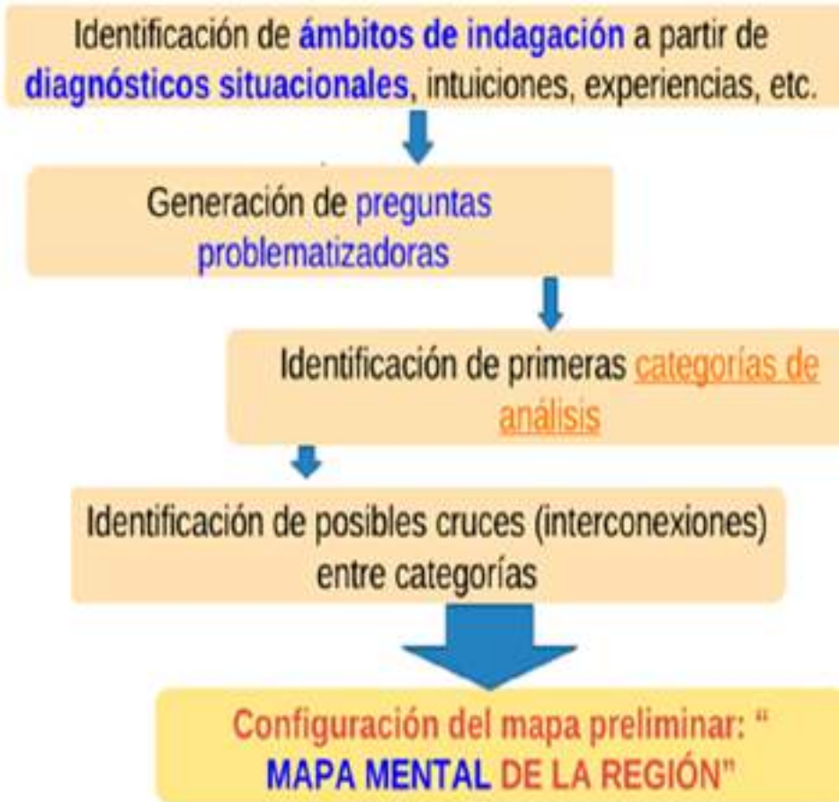
Figura 2. Metodología para levantamiento de mapas de conocimiento regional.

Fuente: Adaptado de Benavides y Quintero (2010).