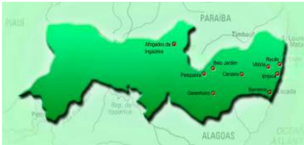
Figura 5. Localização dos campi do Instituto Federal de Educação, Ciência e Tecnologia no Estado do Pernambuco, Brasil.

Em 2008, através da Lei nº 11.892, foi instituída a Rede de Educação Profissional, Científica e Tecnológica e foram criados os Institutos Federais de Educação, Ciência e Tecnologia. A partir daí, o Instituto Federal de Educação, Ciência e Tecnologia de Pernambuco passou a ser constituído por um total de nove campus , a saber: os de Barreiros, Belo Jardim, Vitória de Santo Antão, Ipojuca, Pesqueira e o campus Recife, todos já implantados, além de mais três campi – Afogados da Ingazeira, Caruaru e Garanhuns – que foram implantados no ano de 2010. A constituição dos diversos campi do Instituto Federal de Educação, Ciência e Tecnologia de Pernambuco (IFPE) foi realizada a partir da base territorial de atuação e caracterização das regiões de desenvolvimento onde os mesmos estão situados, o campus Barreiros é uma escola fazenda, com 207 hectares, dos quais aproximadamente 2% representam a área construída (Figura 5 e Figura 6).