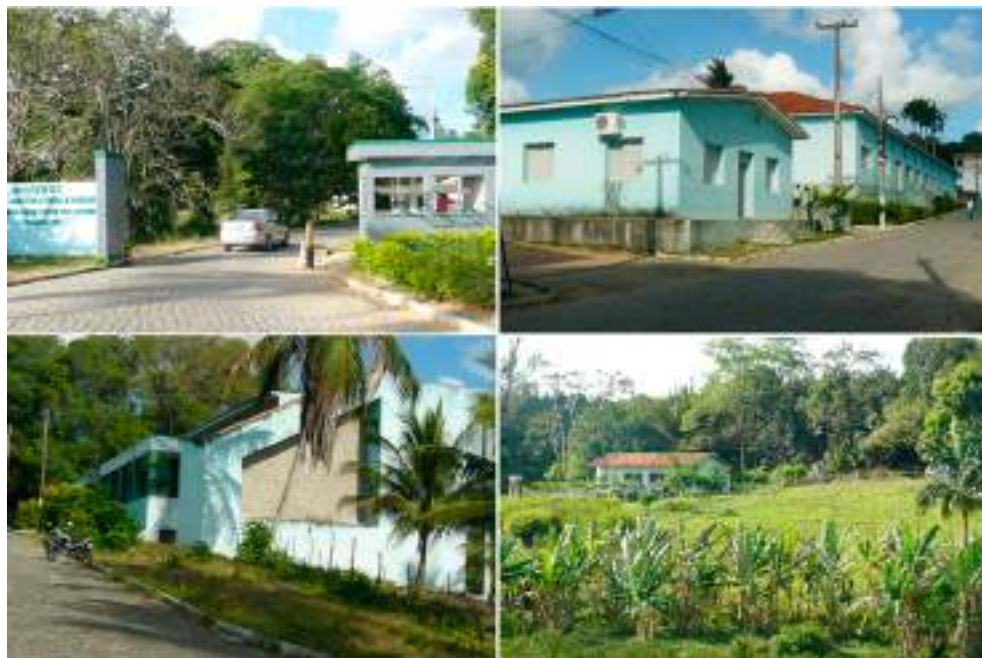
Figura 6. Fotos do Instituto Federal de Educação, Ciência e Tecnologia, Campus Barreiros, Pernambuco, Brasil

As fotos, no sentido horário, mostram a: Entrada principal do campus; Sala do Curso Superior de Tecnologia em Agroecologia; Área técnica do curso de agricultura, e; Biblioteca central.