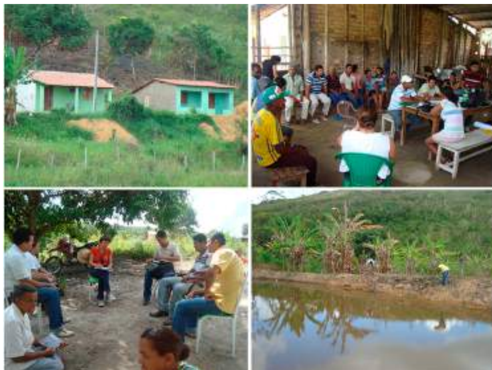
Figura 1. Fotos de Bom Jardim, assentamento de reforma agrária, no município dos Barreiros, Pernambuco, Brasil.

Em todos os assentamentos localizados na Zona da Mata Sul, a origem dos assentados é do meio rural. Antes do assentamento, 68% estavam ocupados na agricultura e 32% estavam ocupados em outras atividades, essencialmente como empregadas domésticas e no comércio. Dos que trabalharam na agricultura, todos já tiveram a oportunidade de trabalhar em usinas do Estado. Destes, mais de 58% deles nunca trabalharam em nenhum outro tipo de atividade a não ser a agricultura, e estes passaram mais de um ano desempregados. Concluindo que naquele momento 87,5% dos assentados estavam trabalhando na agricultura de subsistência para consumo e comercialização em feiras livres.