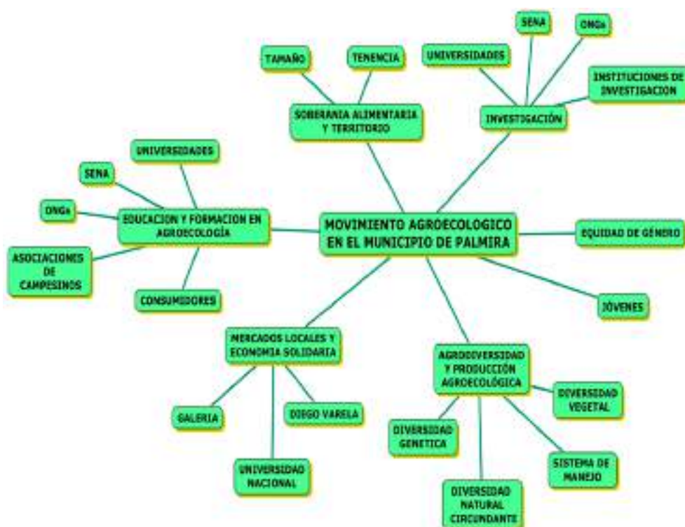
Figura 3. Mapa de conocimiento del movimiento agroecológico en la ciudad de Palmira.

Se encontró que la ciudadanía ambiental y la agroecología son herramientas valiosas para la sustentabilidad y que el concepto de ciudadanía ambiental adquiere relevancia y pertinencia a la hora de asumir el compromiso ético y político para modificar radicalmente los patrones de vida y consumo que son necesarios para superar la crisis ambiental contemporánea. La agroecología, en sus tres dimensiones (técnico-científica, socioeconómica y ético-política), se constituye en una vía firme para la sustentabilidad. Se halló, igualmente, que la ciudadanía ambiental va más allá del cumplimiento de deberes y derechos y que, junto con la agroecología, son expresiones que contribuyen ostensiblemente en la construcción de nuevas formas de relación cualitativamente distintas entre la sociedad y la naturaleza (ver Figura 3).