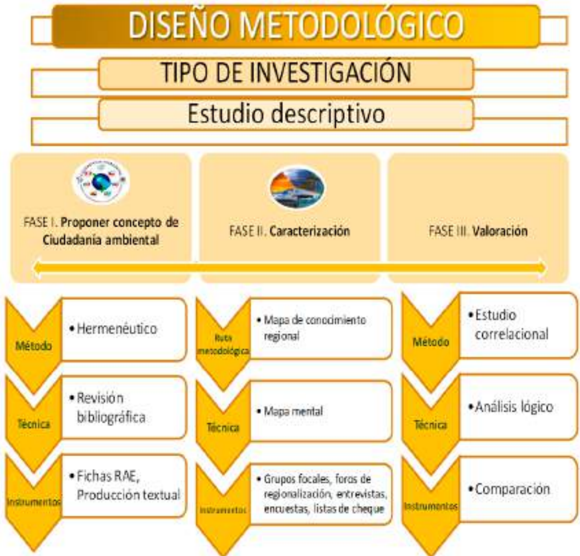
Figura 1. Diseño Metodológico.