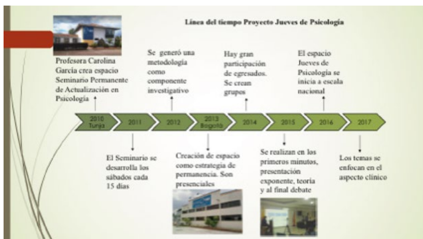
Figura 1. Línea del tiempo para la reconstrucción histórica

Como resultado de la consulta de fuentes primarias, relacionadas con actores que hicieron parte del espacio académico, así como desde la consulta de algunos registros encontrados, se pudo establecer la siguiente línea del tiempo: