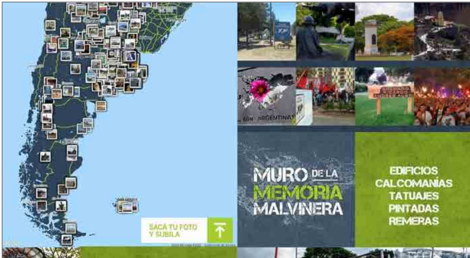
Figura 4. Muro de la Memoria Malvinera