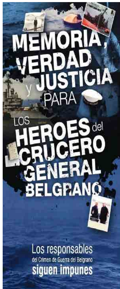
Figura 6. Memoria, verdad y justicia para los héroes del Belgrano