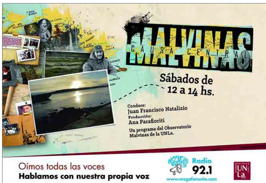
Figura 7. Malvinas Causa Central