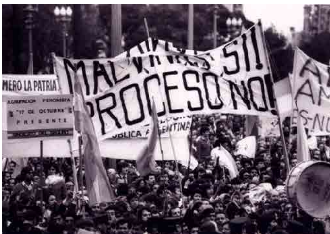
Figura 1. Manifestación en la Plaza de Mayo