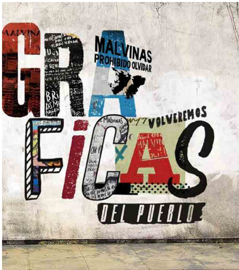
Figura 8. Gráficas del Pueblo