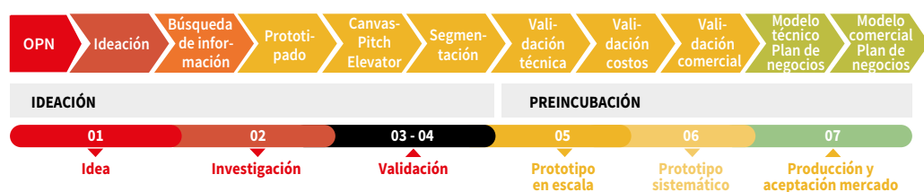
Figura 33. Ruta emprendedora de las temáticas de atención