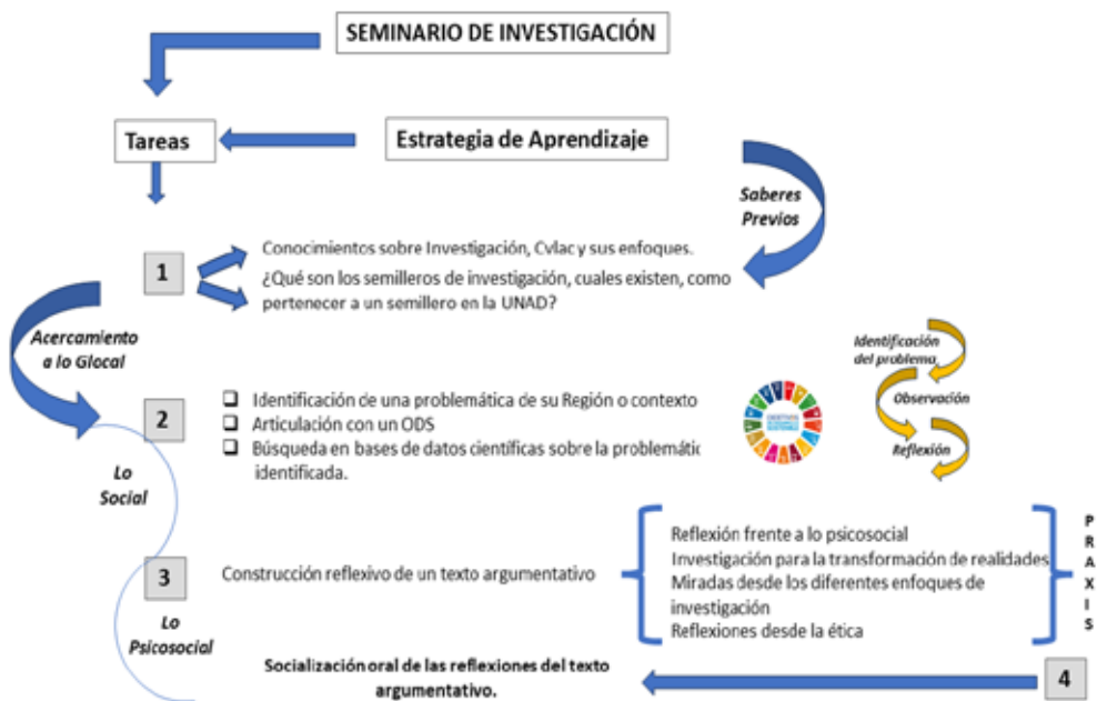
Figura 36. Ruta formativa del estudiante

Como se puede evidenciar en la figura 36, se inicia este recorrido haciendo un reconocimiento a los semilleros de investigación como espacio formativo, que contribuyen a la generación de nuevo conocimiento, fortalecen la formación académica de los futuros profesionales y los prepara para enfrentar los desafíos del mundo laboral con una visión más amplia y actualizada.