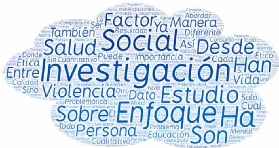
Figura 37. La acción psicosocial y la investigación

En esta nube de palabras, es preciso destacar el término “investigación”, ubicada en el centro, lo cual resalta su papel protagónico desde una perspectiva social. Esta centralidad responde claramente a su relación con diversos enfoques metodológicos —como el cualitativo y el cuantitativo—, lo que permite al estudiante comprender que la investigación no solo posee un valor técnico, sino también un sentido social profundo. En