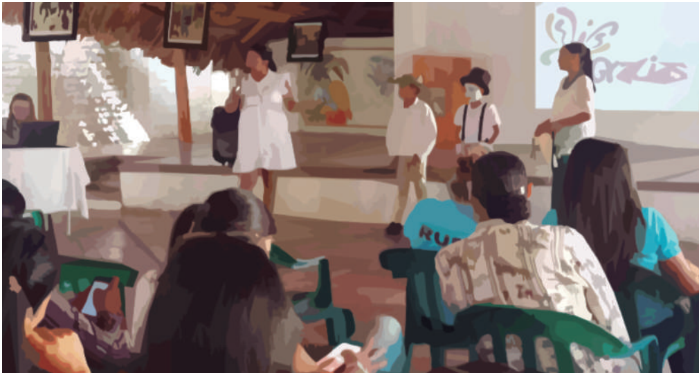
Figura 5. Viajeros dando a conocer el impacto del proyecto de resignificación de sus prácticas pedagógicas