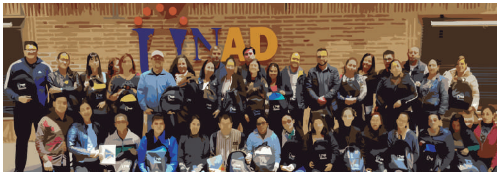
Figura 3. Viajeros cargados de nuevos aprendizajes, en sus maletas las nuevas ideas para seguir contribuyendo a construir una mejor sociedad