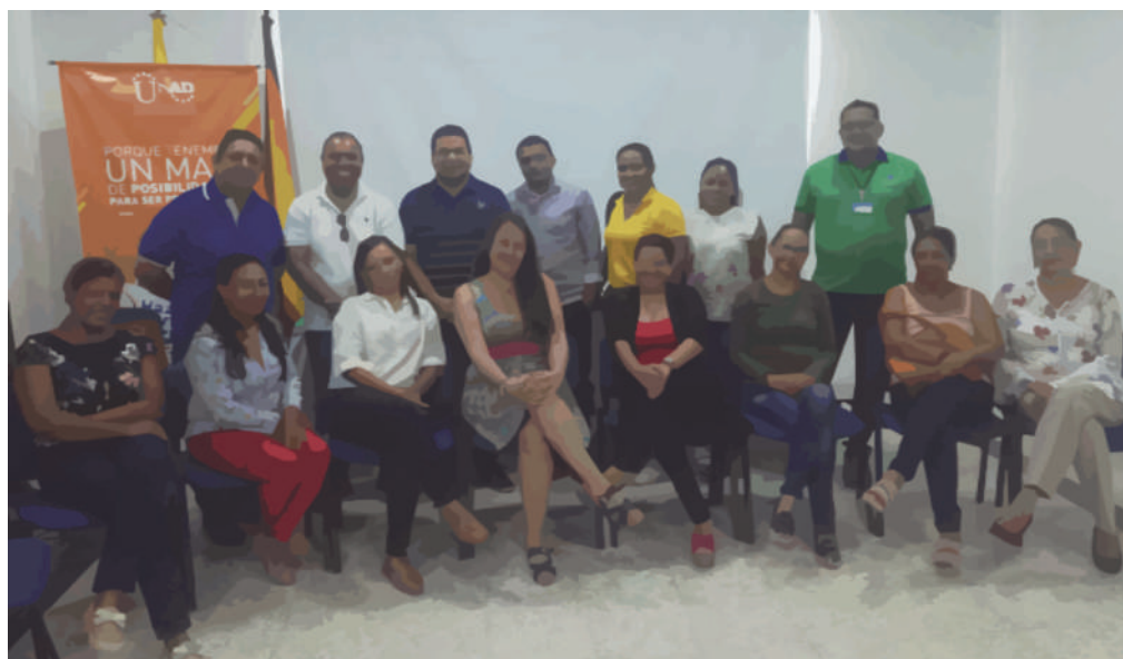
Figura 6. Acompañamiento de In Situ, docentes ECDF II