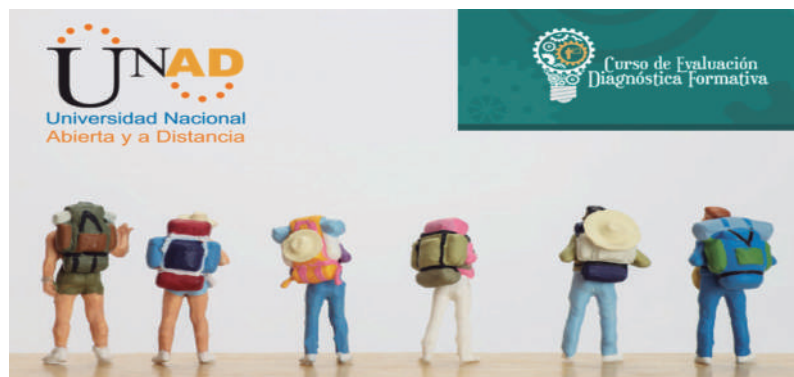
Figura 2. Viajeros cargados de experiencias significativas