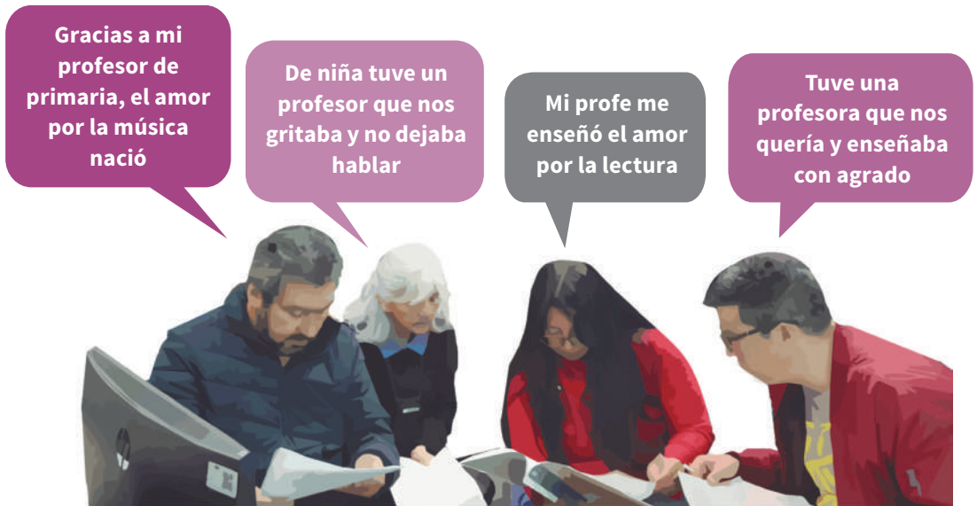
Figura 1. Recordando a mi maestro