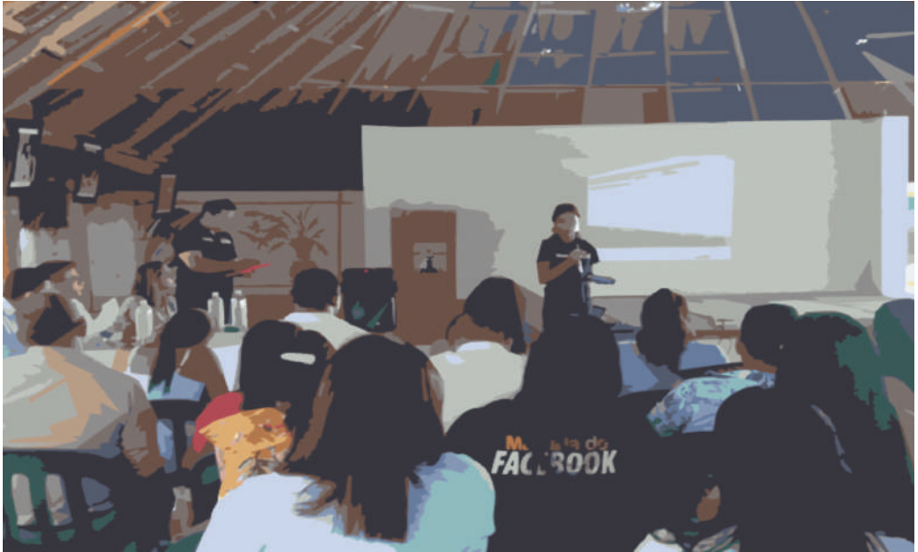
Figura 4. Viajeros dando a conocer el impacto de su proyecto de resignificación de sus prácticas pedagógicas