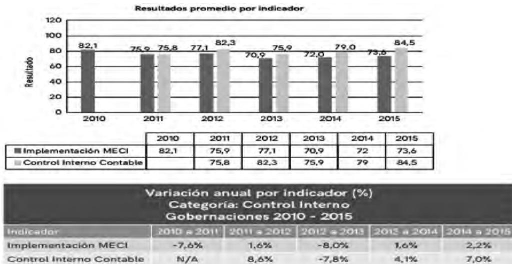
Figura 3. Implementación Meci de las Gobernaciones 2010 - 2015.

De acuerdo con los indicadores de IGA, se observa el indicador del Modelo Estándar de Control Interno, en el período 2010 – 2015 y refleja el comportamiento siguiente: