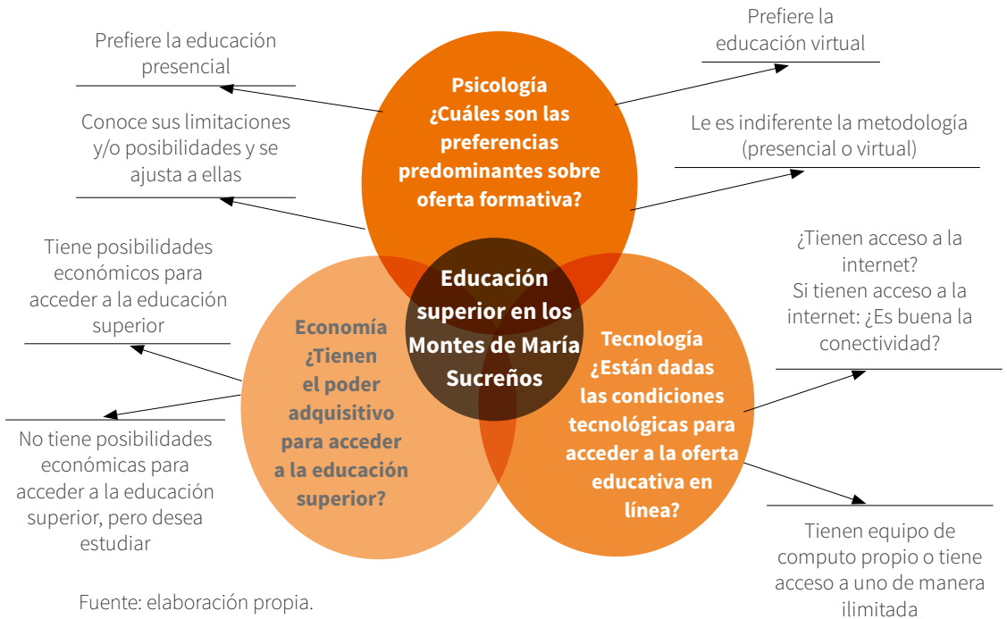
FIGURA 2. Síntesis de estudio (2018)

La síntesis del estudio la hemos plasmado en la siguiente figura: