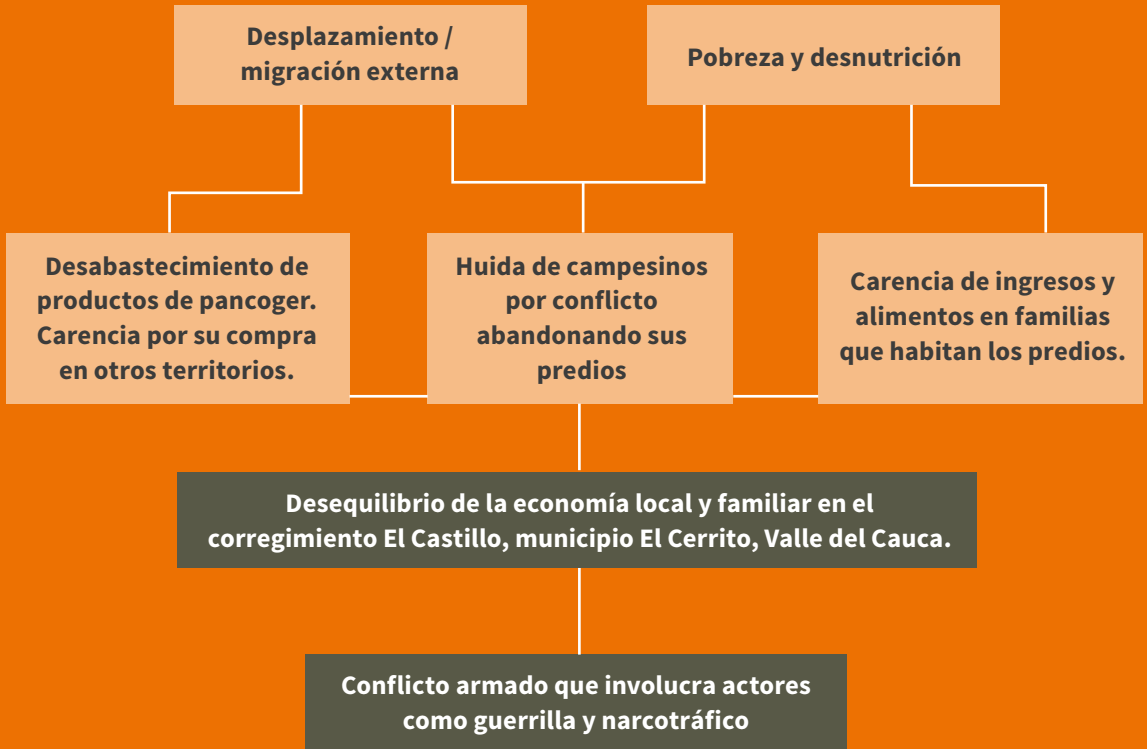
FIGURA 1. Árbol del problema patios productivos