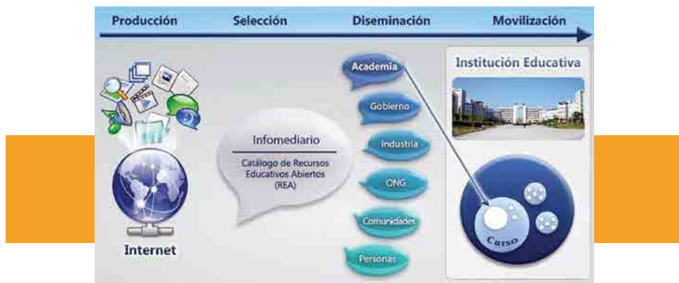
Figura 1. Movilización del conocimiento con recursos educativos abiertos